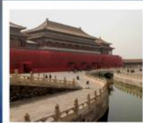
พระราชวังกรุง