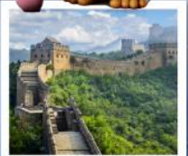
กำแพงเมืองจีนด่านซือหม่าไท่

เมืองโบราณกุ่เป่ย์ซู่ยจิน / กำแพงเมืองจีนด่านซือหม่าไท่ (รวมค่ากระเช้าขึ้น-ลง) / ชมวิวกำแพงเมืองจีนและเมืองโบราณ ยูนิเวอร์แซลปักกิ่ง (รวมค่าบัตรเข้า) / จัตุรัสเทียนอันเหมิน / พระราชวังโบราณกรุง / หอบูชาเทียนถาน คาเฟ่กาแฟบ้านน้ำตาล (TANG FANG CAFE) / พระราชวังฤดูร้อนอวิ๋เหอหยวน / ย่านชานหลี่ถุน (POP MART) / ถนนคนเดินไท่กู่หลี่