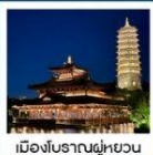
เมืองโบราณฝูหยวน