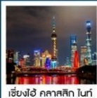
เซี่ยงไฮ้ คลาสสิก ไนท์