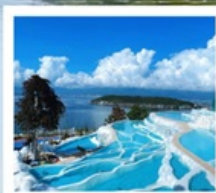
ซานโตรินี่ต้าหลี่

“เกาะเสี้ยวผู่...เกาะลึกลับกลางทะเลสาบ เอ้อไห้”