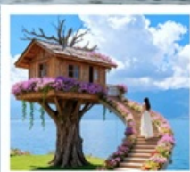
หมู่บ้านเหวินปี้

เมืองโบราณต้าหลี่ / นั่งเรือสู่เกาะเสี้ยวผู่ไถว / ซานโตรินี่ (รวมรถแบตเตอร์) / ถนนทางแอร์ต้าต้า / กุาฮวี่ยนเซียงซาน / ต้าซ่าท่าเรือหลงกัน โค้ง S ทะเลสาบเอ้อไห้ / หมู่บ้านโบราณสี่จิว / หมู่บ้านเหวินปี้ / ชมดอกไม้ตามฤดูกาล