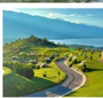
กุาฮวี่ยนเซียงซาน