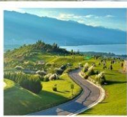
กุขาววินเซียงซาน