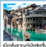
เมืองโบราณกุ่ป๋ายสู่ยเจิน