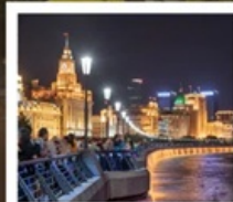
เซี่ยงไฮ้คลาสสิกไท่

เซี่ยงไฮ้ คลาสสิก ไท่ / 3 ตึกใหญ่แห่งเซี่ยงไฮ้ ล่องเรือหมู่บ้านโบราณจูเจียเจี้ยว / EKA Tianwu / ถนนหวยไห่ วัดหลงหัวแลนด์มาร์ก จางหยวน / ซินเทียนตี้ / ชมโชว์ ERA ที่โรงละครโด่งดังระดับโลก