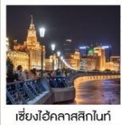
เซี่ยงไฮ้คลาสสิกไนท์