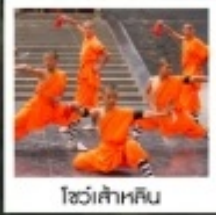
โชว์เส้าหลิน

ตลาดกลางคืนไคเฟิง / ประตูเมืองเก่าต้าหลี่หยิงเหมิน / สวนชิงหมิงซิ่งเหอ / อุทยานหยุ่นโกซาน (รวมรถอุทยาน) วัดเส้าหลิน (รวมรถแบบเตอร์) / ป่าเจดีย์ / โชว์การแสดงวิทยายุทธเส้าหลิน / โชว์ SHAO LIN MUSIC CEREMONY / ถ้ำหินหลงเหมิน (รวมรถแบบเตอร์) สุสานเทพเจ้ากวนอู / ถนนคนเดินลี่จิ่งเหมิน / เมืองลั่วอี้ + ฟริสซูดพื้นที่เมืองชาวฮั่น / กำแพงเมืองอิ่งเกียมนเหมิน โชว์ราชวงศ์ถัง / พิพิธภัณฑ์ทองกัฟใต้ดินทหารม้าจีนซี (รวมรถแบบเตอร์) / กำแพงเมืองโบราณซีอัน / จัตุรัสหอรบะยัง + หอกหลง ตลาดมุสลิม / เจดีย์ห้าพันปีใหญ่ / ถนนคนเดินวัฒนธรรมต้าถิง