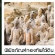
พิพิธภัณฑ์ทองกัฟใต้ดิน