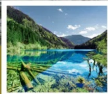
จิวจ้ายโกว