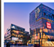
ย่านซานหลี่ตุ่น