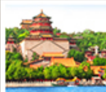
อวี่เหอหยวน