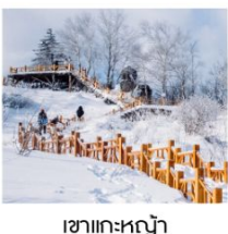
เขาเกะหลัว

ฟรี!! ...ถุงมือ ผ้าพันคอ หมวก ท่านละ 1 ชุด