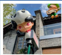
ถนนคนเดินซอยกว้างแคบ