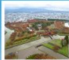
โทริยิวกะกุ ทาวเวอร์

หุบเขานรกจิโระคุดาบิ / โทดองฮิจูเอ็งคานเนโมชิ ตลาดเช้าเมืองฮาโกดาเตะ / โทริยิวกะกุ ทาวเวอร์ ภูเขาไฟอุสุ / จุดชมวิวยุซึกิ / ค่องเรือชมทะเลสาบโทบะ สวนอุสึกิโตะ / สวนพฤกษศาสตร์ / เก็บผลไม้ / สัมผัสน้ำพุร้อน พิพิธภัณฑ์คองดงดงชิ / ภาวนิศาโอนำโบราณ / โรงเบียร์โทบะอิชิ เนินพระพุทธรเจ้า / ถนนฮิโอบะบิงทากุโกจิ / ย่านฮูซุกิโนะ