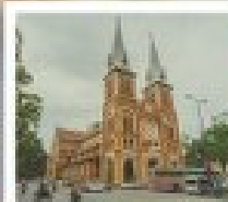
โบสถ์ มอซงทงอิม