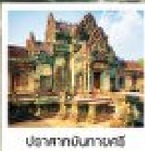
ปราสาทหินเทพารักษ์