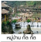
หมู่บ้าน กัด กัด