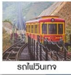
รถไฟวินเทจ