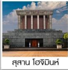
สุสาน โฮจิมินห์