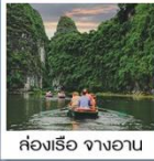
ล่องเรือ จางอาน