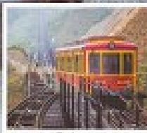
รถไฟวินเทจ