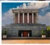
สุสาน โฮจิมินห์