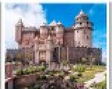
บ้านฮิลล์

แพ็คเกจส่วนตัว 7 - 9 ท่าน **ราคานี้ไม่รวมตัวเครื่องบิน**