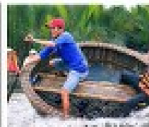
นั่งเรือกระด้ง