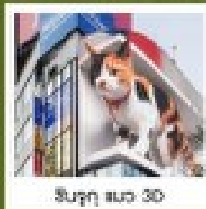
ชินจูกุ นมว 3D

คัมภีร์เมนูคุดฟีเกช บุฟเฟ่ต์ฮามญี่ปุ่นอื่น