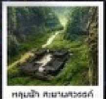
อุทยานหลุมฝังศพพานชวอว