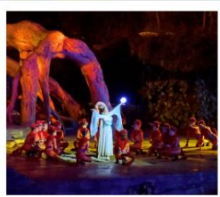
โซว์จิ้งจอกขาว