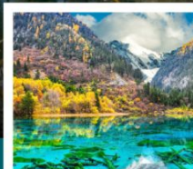
จิวจ้ายโกว