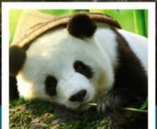
ศูนย์หมีแพนด้า