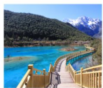
ปิ๋สุ่ยเหอ