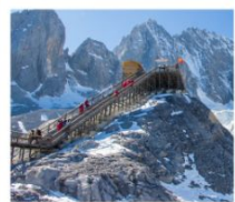
กุวาช่าหมิงกรหยก

เมืองโบราณด้าหลี่ / เจดีย์สามองค์ / โถงแรกแม่น้ำแยงซี / เมืองโบราณแชงกรี่ล่า วัดลามะซงจันหลิง / ซ่องแคบสี่กักระโดด / เมืองโบราณชู่เหอ / กุวาช่าหมิงกรหยก หุบเขาพระจันทร์สีน้ำเงิน / โข่วจางอวี๋หมว / สระน้ำมังกรดำ - เมืองโบราณลี่เจียง เขาสีซาน / ประตุมังกร / วัดหยวนทง / สวนด้ากวนโหลว