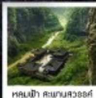
หลุมฟ้า สะพานสวรรค์