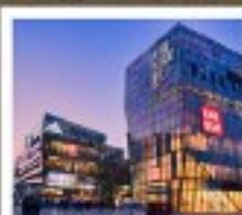
ย่านชานหลี่ตุ่น