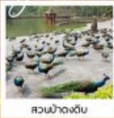
สวนน้ำงดิง