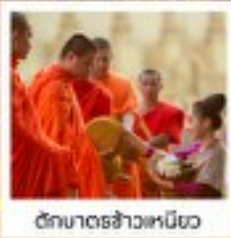
วัดมหาธาตุหลวง