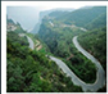
ไท่หิงซาน

หอซุนฮิว / ห้างสรรพสินค้าฟ้างวงหยก เมืองโกเป็ง / สวนชิงหิงซ่างเหอหยวน โชว์ราชวงศ์ซ่ง / แกรนด์เกนยอนไท่หิงซาน หุบเขาดอกท้อ / ถนนลอยฟ้า หมู่บ้านทิวเขียงซุม / วัดเก้าหีบ ถ้ำหินหลงหมิน / เมืองโบราณทิวอี่ โชว์การแสดงวิทยาศาสตร์ล้ำสมัย