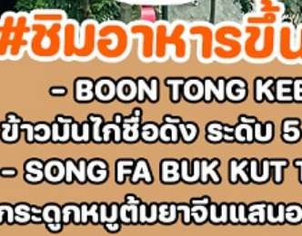
#ชิมอาหารขึ้นชื่อ - BOON TONG KEE ข้าวมันไก่ชื่อดัง ระดับ 5 ดาว - SONG FA BUK KUT TEH กระดูกหมูต้มยาจีนแสนอร่อย