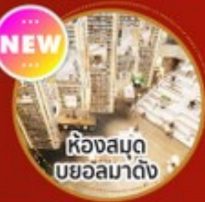
ห้องสมุด บยอลมาดิง