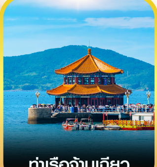
ท่าเรือจันทิว