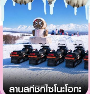
ลานสกีชิโกะโนะโอกะ