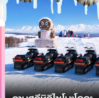
ลานสกีซึกิโซโนะโอกะ