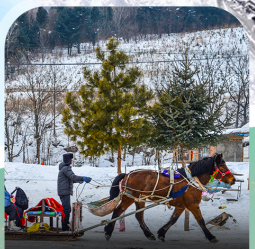
นั่งม้าลากเลื่อน

คอนเฟิร์ม ออกเดินทาง ทุกพีเรียด 2 ท่านขึ้นไป