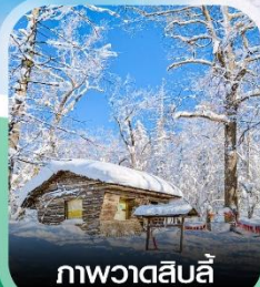
ภาพวาดสีบลู