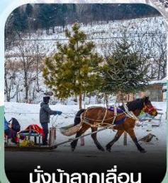
นั่งม้าลากเลื่อน