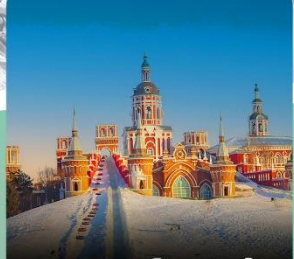
คฤหาสน์วอลกา