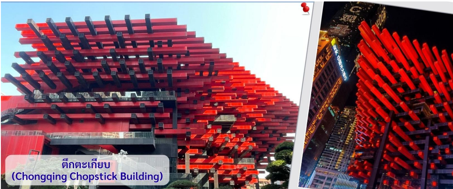
ตึกตะเกียบ (Chongqing Chopstick Building)

จากนั้นอิสระถ่ายรูปหน้า ตึกตะเกียบ ฉงชิ่ง(ด้านนอก) คือ ฉงชิ่งกั๋วไท่อาร์ตเซ็นเตอร์ (Chongqing Guotai Arts Center) เป็นแลนด์มาร์กสำคัญที่มีสถาปัตยกรรมคล้ายตะเกียบยักษ์สีแดงและด่างวางซ้อนกัน เป็นศูนย์จัดแสดงงานศิลปะและสถานที่ท่องเที่ยวที่นิยมสำหรับการถ่ายรูป โดยเฉพาะในเวลากลางวันเมื่อเปิดไฟสวยงาม สิ่งก่อสร้างอันมีเอกลักษณ์ อาคารนี้ถูกวางโครงสร้างให้มีรูปร่างคล้ายกอง "ตะเกียบยักษ์" สีดำและแดงที่วางซ้อนกันเป็นชั้นๆ ที่ส่วนปลายของตะเกียบสีแดงจะมีตัวอักษรจีนคำว่า "กั๋ว" ประทับอยู่ ซึ่งมีความหมายถึง ชาติหรือประเทศ ส่วนที่ปลายตะเกียบสีดำ จะมีอักษรจีนคำว่า "ไท่" ประทับอยู่ ซึ่งหมายถึง ความเจียบสงบ หรือความอุดมสมบูรณ์