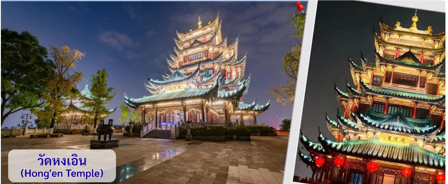
วัดหงเอิน (Hong'en Temple)

ที่ซ่อนตัวอยู่ในมหานครไซเบอร์ฟังก์ "ไฮไลท์ที่ห้ามพลาดเด็ดขาดคือ การชมวิวยามค่ำคืน เมื่อถึงเวลาเปิดไฟ (ประมาณ 18:30 - 19:30 น. เป็นต้นไป ขึ้นอยู่กับฤดูกาล) ตัวศาลาจะส่องแสงทองอร่ามตัดกับความมืดและแสงไฟของตึกระฟ้าโดยรอบ นักท่องเที่ยวนิยมใส่ชุดฮั่นฝู (Hanfu) มาเดินถ่ายรูปตามบันไดและระเบียงทางเดิน ซึ่งให้บรรยากาศคล้ายหลุดเข้าไปในนิมโม่เรื่อง Spirited Away และยังเป็นจุดชมวิวกาสิโนรามาที่สามารถมองเห็นแม่น้ำเจียงหลง รวมถึงเขตหยูจางและเจียงเป่ย์ได้แบบ 360 องศา