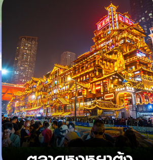
ตลาดหงหย่าต้ง