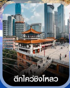
ตึกไควซิงโหลว

✈️ คอนเฟิร์มออกเดินทาง ทุกพีเรียด 2 ท่านขึ้นไป