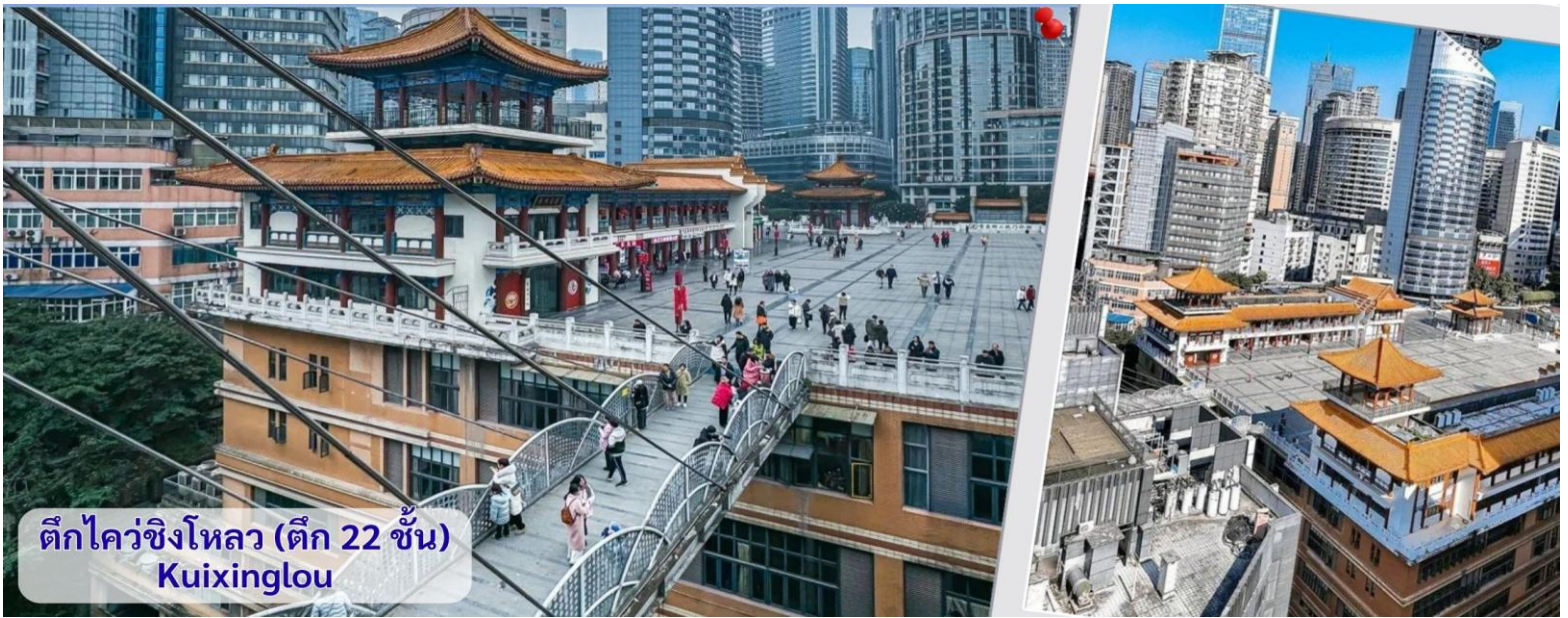
ตึกไควชิงโหลว (ตึก 22 ชั้น) Kuixinglou