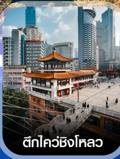
ตึกไค่ว์ซิงโหลว