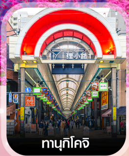
ทามุกิโคจิ

คอนเฟิร์ม ออกเดินทาง ทุกพีเรียด 2 ท่านขึ้นไป