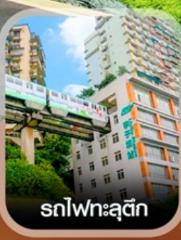
รถไฟฟ้าลูติก

คอนเฟิร์มออกเดินทาง ทุกพีเรียด 2 ท่านขึ้นไป