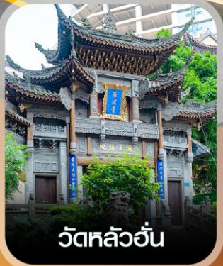
วัดหลัวอัน