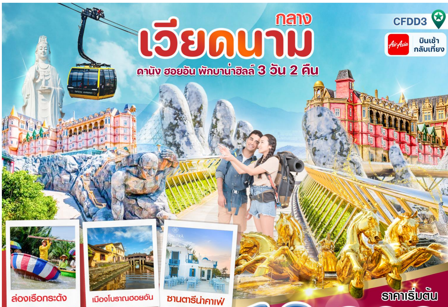
ล่องเรือกระดิง