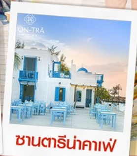
ซานตารีน่าคาเฟ่