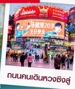
ถนนคนเดินหวงซิงสู