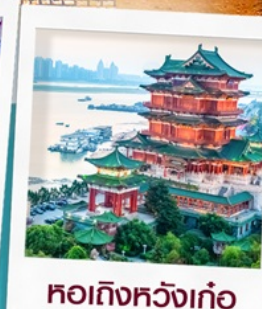
หอถึงหวงเก้อ