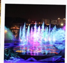
โชว์น้ำสามมิติ OCT BAY WATER SHOW