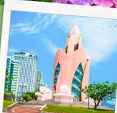
อาคารตอกบัว