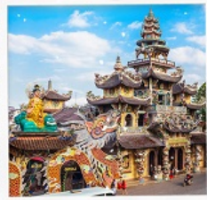
วัดมังกร