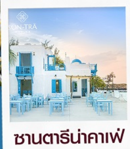
ซานตารีนาคาเฟ่