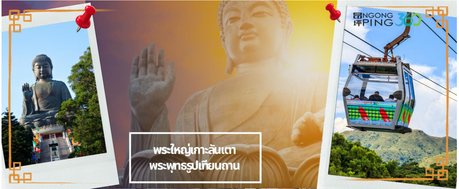
พระใหญ่เกาะลันเตา พระพุทธรูปเทียบถ่าน

จากนั้นนั่งกระเช้ากลับลงมายังสถานีตุงชุงและนำท่านช้อปปิ้งที่ ซิตี เกท เอาท์เล็ต (CITY GATE OUTLET) เป็นเอาท์เล็ตขนาดใหญ่ที่สุดของฮ่องกง อยู่ใกล้กับสนามบินฮ่องกง ติดกับสถานีรถไฟ TUNG CHUNG STATION ซึ่งมีสินค้าแบรนด์เนมระดับโลกมากมาย เป็นที่นิยมของนักท่องเที่ยวหรือแม้กระทั่งคนท้องถิ่นเอง ก็มาช้อปปิ้งกันที่นี่ นอกจากส่วนของห้างแล้วยังมีร้านอาหารต่างๆ, ศูนย์อาหาร FOOD REPUBLIC, ซูเปอร์มาร์เก็ต, โรง