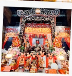
วัดเทพเจ้ากวนอู