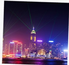
โชว์ SYMPHONY OF LIGHT