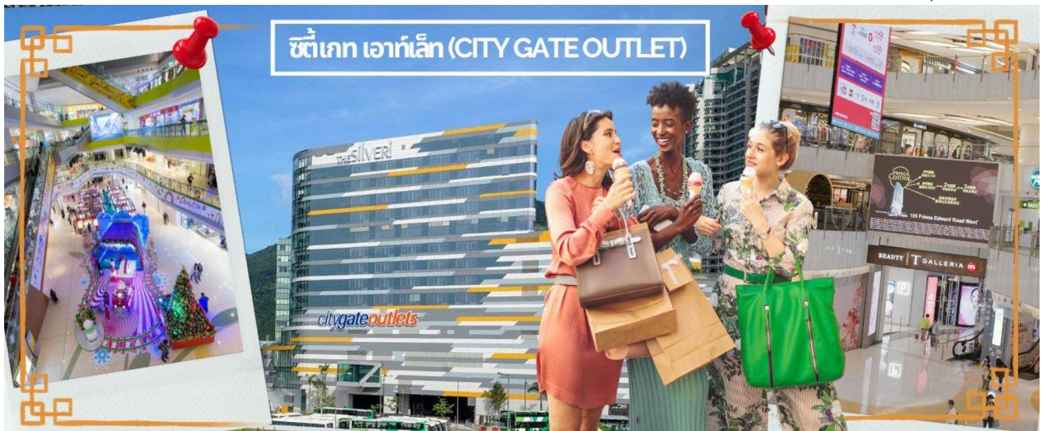
ซิตี เกท เอาท์เล็ต (CITY GATE OUTLET)

ภาพยนตร์ และโรงแรม NOVOTEL CITY GATE HONG KONG ห้าง CITY GATE OUTLET มีแบรนด์ต่างๆให้เลือกมากกว่า 90 แบรินด์ เช่น NIKE, ADDIDAS, NEW BALANCE, BURBERRY, COACH, MICHEL KOR, KATE SPADE, POLO RALPH LAUREN, THE NORTHFACE, ARMANI EXCHANGE, BALLY, CROCS, COLUMBIA, ESPRIT, EVISU, GUESS, GIORDANO, LEVIS, LACOSTE, PUMA, TUMI และ TIMBERLAND ให้ท่านได้ช้อปปิ้งกันอย่างจุใจ