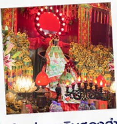
เจ้าแม่กวนอิมฮ่องฮำ