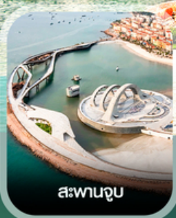
สะพานจูป

คอนเฟิร์มออกเดินทาง ทุกพีเรียด 2 ท่านขึ้นไป