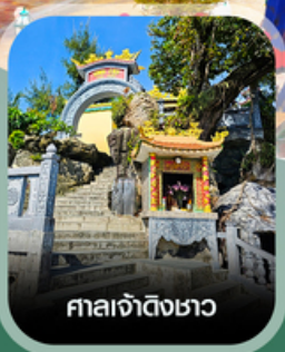
ศาลเจ้าดิ้งซาอว