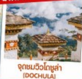
จุดชมวิวดอชูล่า (DOCHULA)