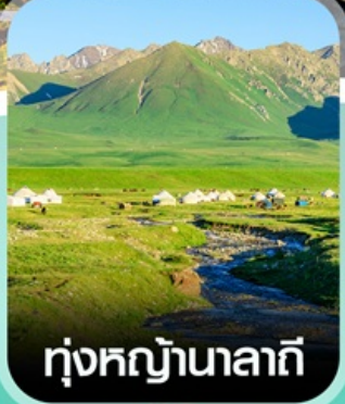
ทุ่งหญ้านาลาถี