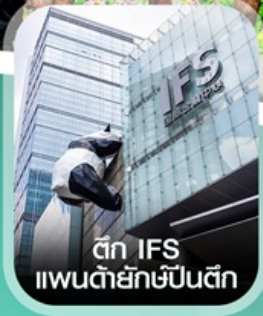
ตึก IFS แพนด้ายักษ์ป็นตึก