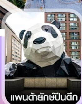
แพนด้ายักษ์ป็นตึก

✈️ คอนเฟิร์มออกเดินทาง ทุกพีเรียด 2 ท่านขึ้นไป