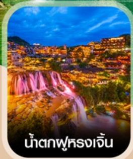
น้ำตกฟูหลงเจิน

สัมผัสสายหมอกแห่งขุนเขา สะพานอ้ายจ้าย แบบพาโรนามา แช่น้ำพุร้อนกลางธรรมชาติ อุทยานป่าไม้บูเออร์เหมิน ชมความอลังการ น้ำตกพันปี หมู่บ้านโบราณผู่หลงเจิน