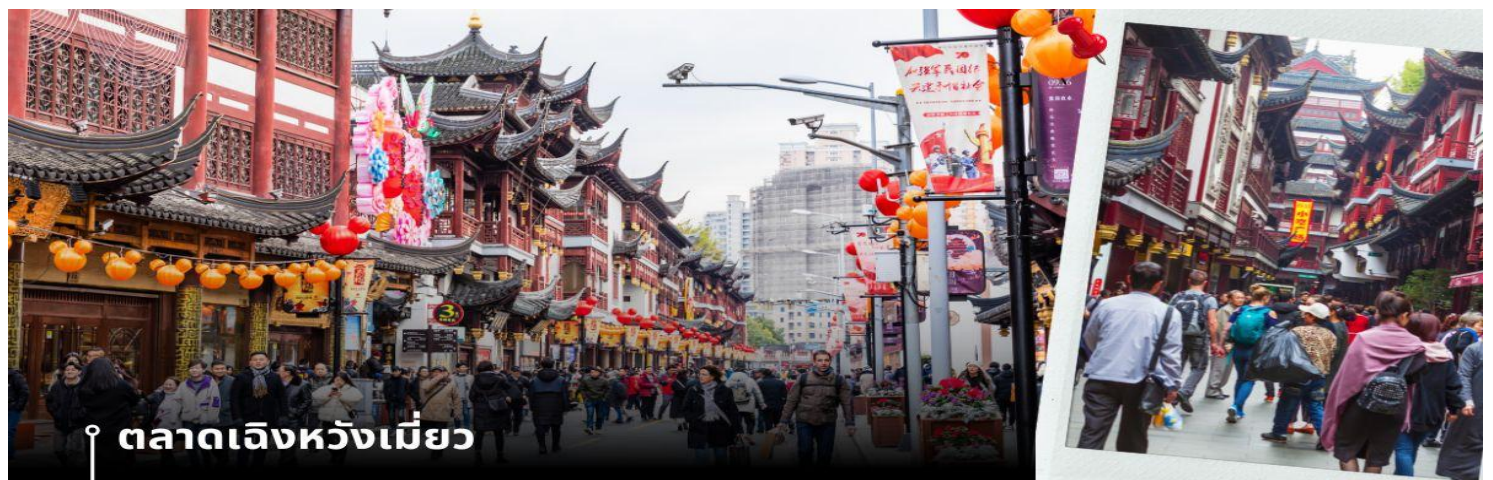
📍 ตลาดเฉินหวังเหมียว

นำท่านเดินทางสู่ หมู่บ้านโบราณจูเจียเจี้ยว มีฉายาว่า เวนิซตะวันออกแห่งเมืองเซียงไฮ้ เป็นอีกหนึ่งย่านเก่าริมน้ำที่มีชื่อเสียงในเซียงไฮ้ มีประวัติศาสตร์ยาวนานกว่า 1700 ปี ซึ่งพื้นที่ทั้งหมดได้รับการอนุรักษ์ไว้เป็นอย่างดี จุดเด่นของเมืองโบราณแห่งนี้คือพื้นที่ด้านในนั้นมีแม่น้ำหลากหลายสายเชื่อมโยงไปยังพื้นที่ต่างๆ โดยรอบ ทำให้มีบรรยากาศที่สวยงามและร่มรื่น และให้ท่าน ล่องเรือ ชมวิวบ้านเรือนเก่าแก่ริมน้ำ ได้เวลาอันสมควรเดินทางสู่ มหานครเซียงไฮ้ จากนั้นนำท่านสู่ ตลาดโบราณ 100 ปี เฉินหวังเหมียว เป็นศูนย์รวมสินค้า และอาหารพื้นเมืองที่แสดงถึงเอกลักษณ์ของชาวเซียงไฮ้ซึ่งมีการผสมผสานระหว่างอดีตและปัจจุบันได้อย่างลงตัว ซึ่งเป็นย่านสินค้าราคาถูกที่มีชื่ออีกย่านหนึ่งของนครเซียงไฮ้ ให้ท่านอิสระช้อปปิ้งตามอัธยาศัย