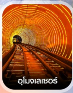
อุโมงเลเซอร์

✈️ คอนเฟิร์มออกเดินทาง ✈️ ทุกพีเรียด 2 ท่านขึ้นไป