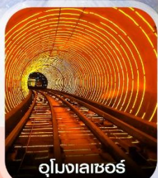
อุโมงเลเซอร์

✈️ คอนเฟิร์มออกเดินทาง ทุกพีเรียด 2 ท่านขึ้นไป