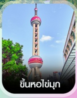
ขึ้นหอไข่มุก