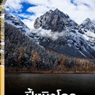
ปี๋เผิงโกว