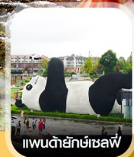
แพนด้ายักษ์เซลฟ์

คอนเฟิร์ม ออกเดินทาง ทุกพีเรียด 2 ท่านขึ้นไป