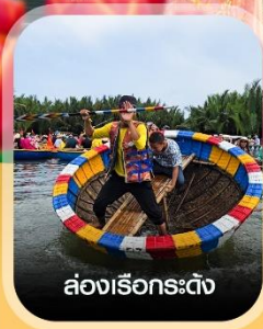
ล่องเรือกระดิ่ง

✈️ คอนเฟิร์ม ออกเดินทาง ทุกพีเรียด 2 ท่านขึ้นไป