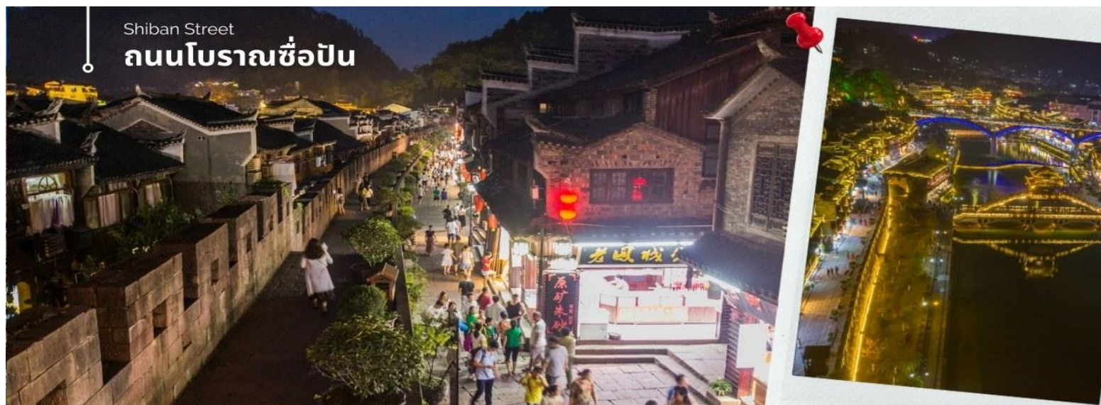
Shiban Street ถนนโบราณชือปิ่น

นำท่านเดินทางโดยรถโค้ชปรับอากาศเข้าสู่ เมืองโบราณเฟิ่งหวง (เมืองหงส์) ใช้เวลาเดินทางประมาณ 3 ชั่วโมง เดินทางถนนโบราณ Feng Hueng Ancient Town ที่ถนนชือปิ่น Shiban Street เมืองที่ยังคงรักษาเอกลักษณ์ความเป็นพื้นเมืองผสมผสานกับยุคปัจจุบันเอาไว้ได้อย่างลงตัววิถีชีวิตของชาวบ้านที่อาศัยอยู่ที่นี่ บรรยากาศในเมืองเฟิ่งหวง ถนนเก่าชือปิ่นเป็นถนนปูหินแคบๆ กว้างไม่ถึง 5 เมตร ทอดยาวจากทางเข้าวัดเต้าเหมินไปทางทิศตะวันตก ผ่านถนนหลายสาย ได้แก่ ถนนนครอส ถนนเจิ้งตะวันออก ถนนเจิ้งตะวันตก ศาลาฮุยหลง หียงเซียวซง เต้าซานลา ศาลาเจี๋ยกั๋ว และสุสานเซินฉงเหวิน สุดท้ายจะนำไปสู่ “น้ำพุแรกไต้ฟ้า” ถนนสายนี้มีความยาวกว่า 3,000 เมตร และเป็นย่านการค้าที่คึกคักที่สุดในเฟิ่งหวง