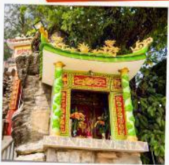
ศาลเจ้าติงซาอู