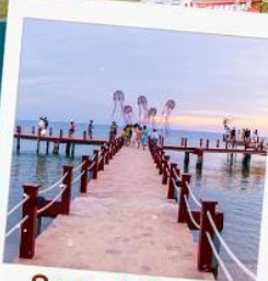
Sunset Sanato Beach Club