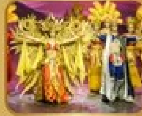
ชมการแสดงโขน