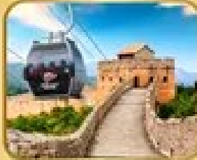
ถ่ายภาพเมืองจีน