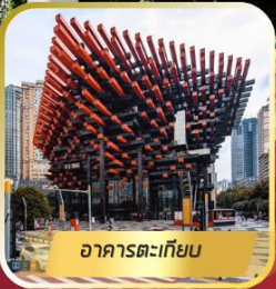
อาคารตะเกียบ