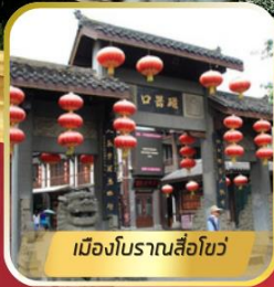
เมืองโบราณสื่อฮั่ว